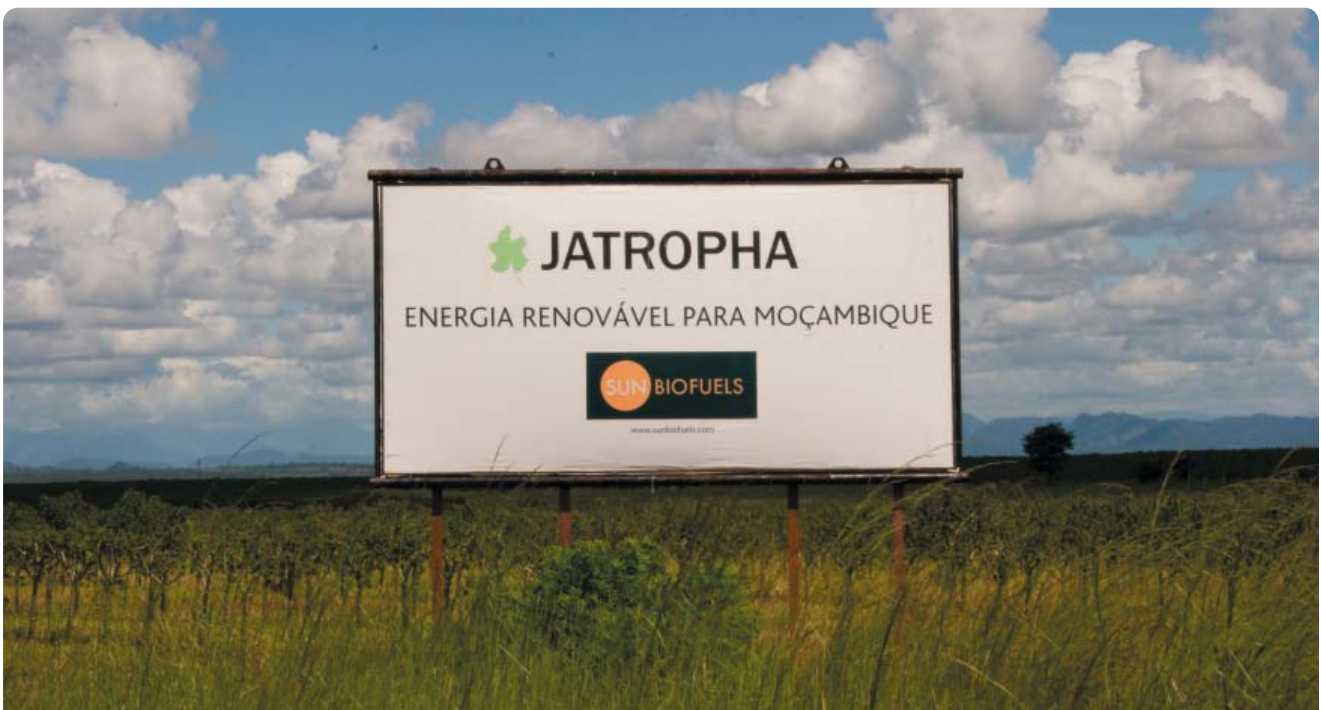
PLANTACIÓN DE JATROFA, PROVINCIA DE MANICA, MOZAMBIQUE

Otras empresas europeas incrementan la lista; por ejemplo ESV Bio Africa Ada (originarias de Ucrania y Reino Unido), Sun Biofuels (Reino Unido), Enerterra y MoçamGalp (Portugal) y AVIAM (Italia). Por su parte la presencia española en Mozambique está incrementándose en los últimos años. Fuentes oficiales nos han informado