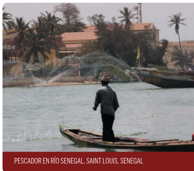
PESCADOR EN RÍO SENEGAL, SAINT LOUIS, SENEGAL

De este marco, se desprenden una serie de recomendaciones que desde Veterinarios Sin Fronteras proponemos al gobierno estatal, para garantizar los derechos y la Soberanía Alimentaria en África.