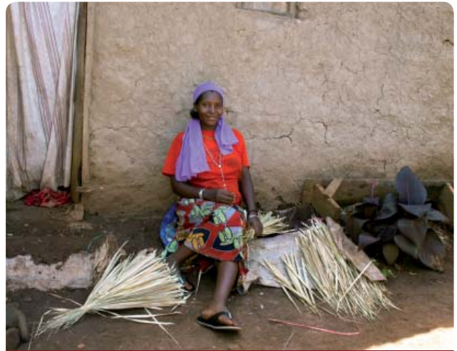
DISTRITO DE MUBENDE, UGANDA