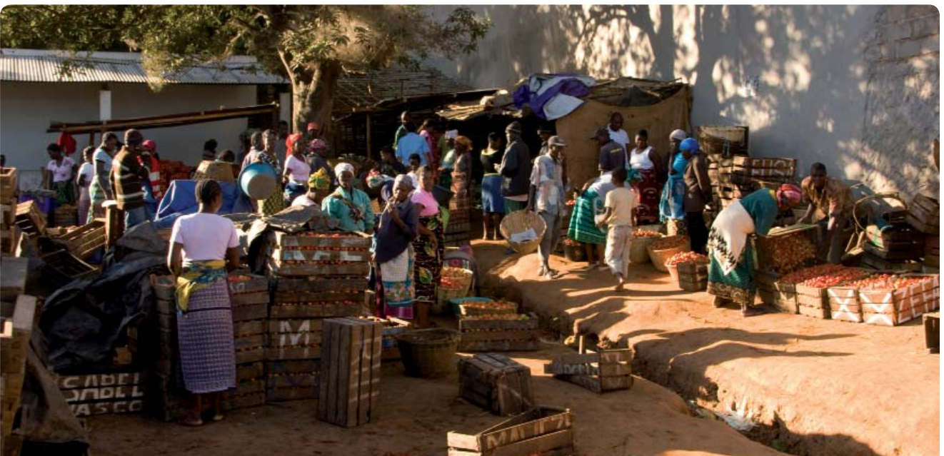
ARRIBA: MUBENDE, UGANDA. ABAJO: MERCADO LOCAL EN CHIMOIO, PROVINCIA DE MANICA, MOZAMBIQUE