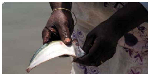
MUJER LIMPIANDO PESCADO EN EL RÍO SENEGAL, SAINT LOUIS, SENEGAL