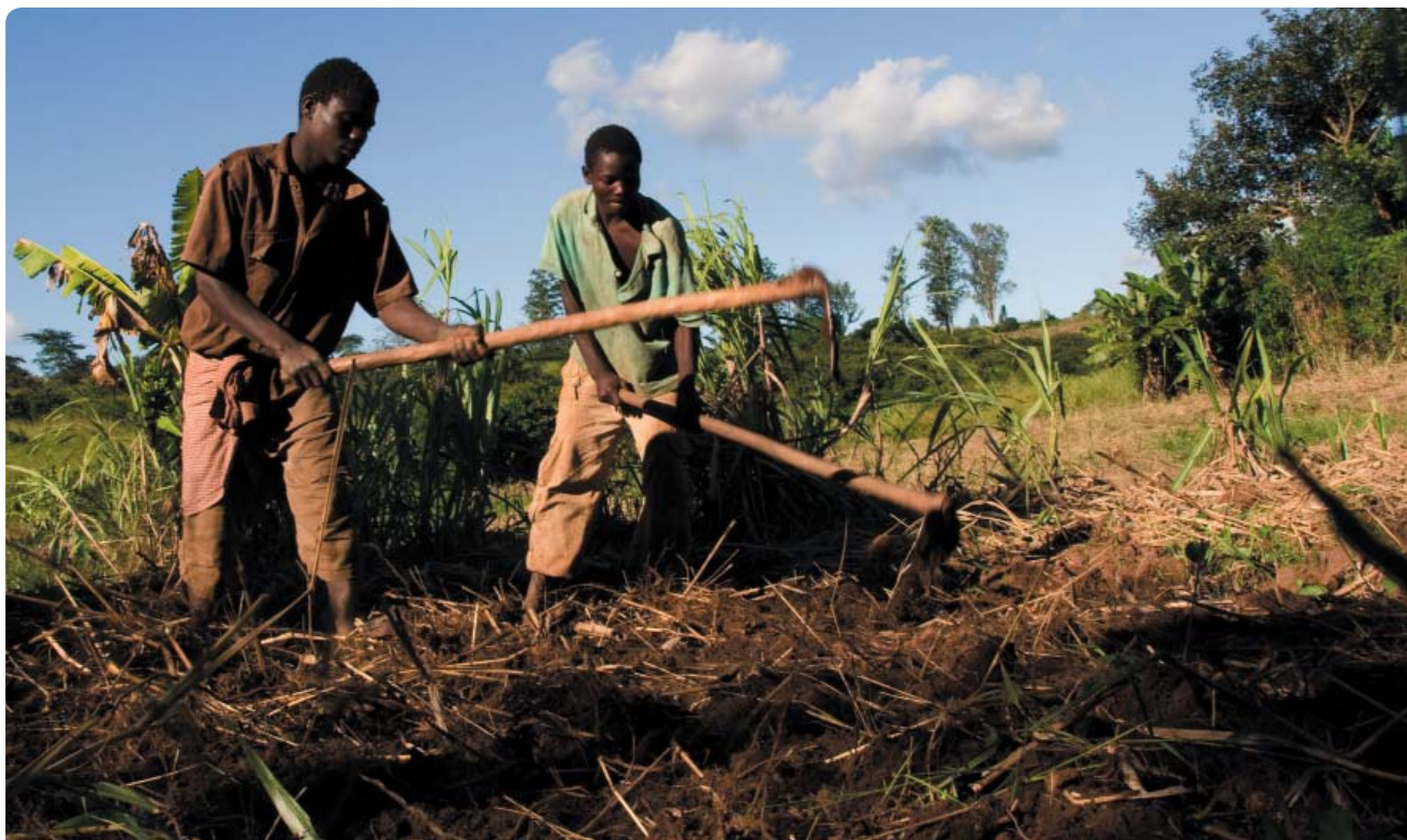
ASOCIACIÓN 16 DE JUNIO, PROVINCIA DE MANICA, MOZAMBIQUE

El Estado debería respetar y promover el respeto, en el seno de la Unión Europea, al principio de coherencia en políticas de desarrollo, reconocido en el art. 208 del Tratado de Lisboa. Para ello debe, entre otras medidas, abandonar o evitar las políticas de apoyo a la producción de agrocombustibles a gran escala, especialmente las metas porcentuales de producción. Y poner fin a la promoción de los agrocombustibles a gran escala que están ejerciendo presión sobre los mercados alimentarios, al tiempo que los y las campesinas son expulsadas de sus tierras.