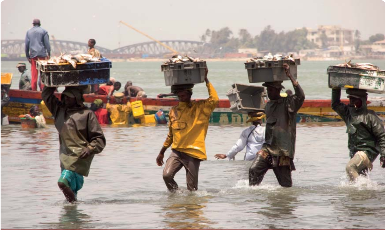
PESCADORES EN EL RÍO SENEGAL, SAINT LOUIS, SENEGAL