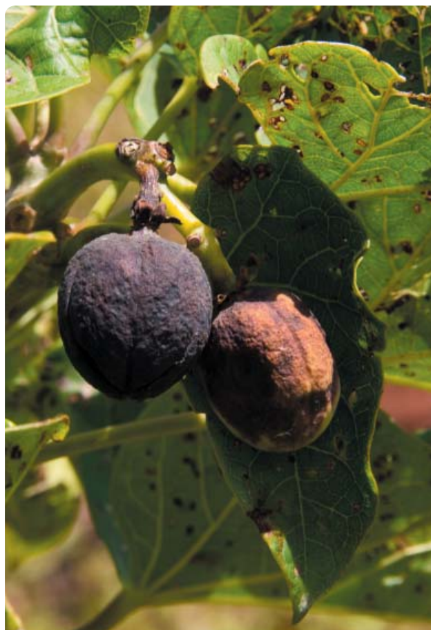
FRUTO DE JATROFA, UTILIZADO PARA LA PRODUCCIÓN DE AGROCOMBUSTIBLES

La situación en África Subsahariana, en cuanto a erosión genética, sigue las premisas mundiales. El fenómeno de apropiación de recursos, llamado ‘biopiratería’, se apoya, con la complicidad de las entidades internacionales y gubernamentales en “derechos de propiedad intelectual” sin tener en cuenta los derechos de los agricultores y las agricultoras que reconocen distintos instrumentos legales, como el Tratado Internacional sobre Recursos Genéticos para la Alimentación y la Agricultura.