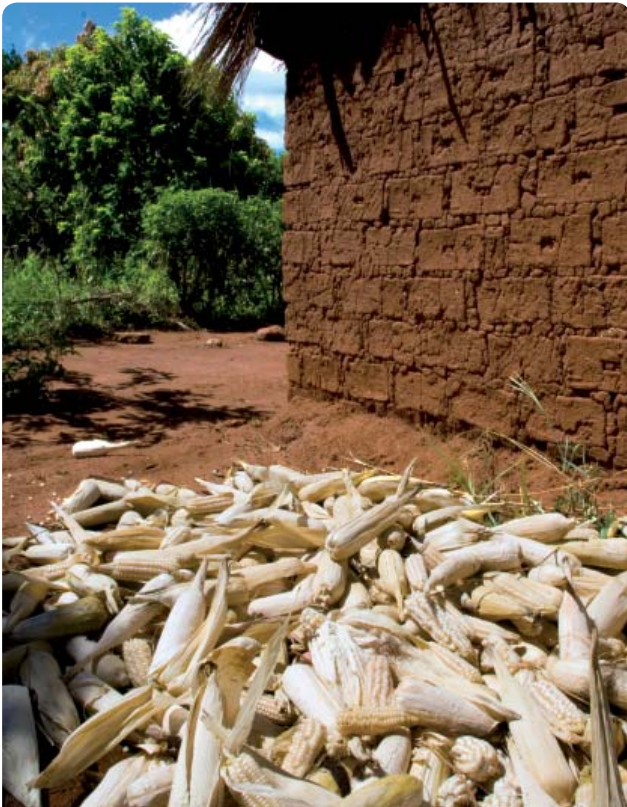
MAÍZ ALMACENADO, PROVINCIA DE MANICA, MOZAMBIQUE